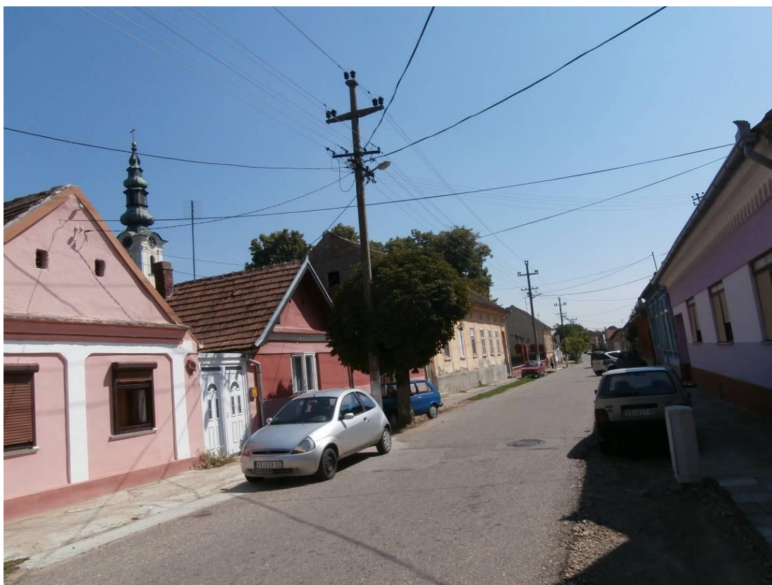
Улица Светосавска – изглед