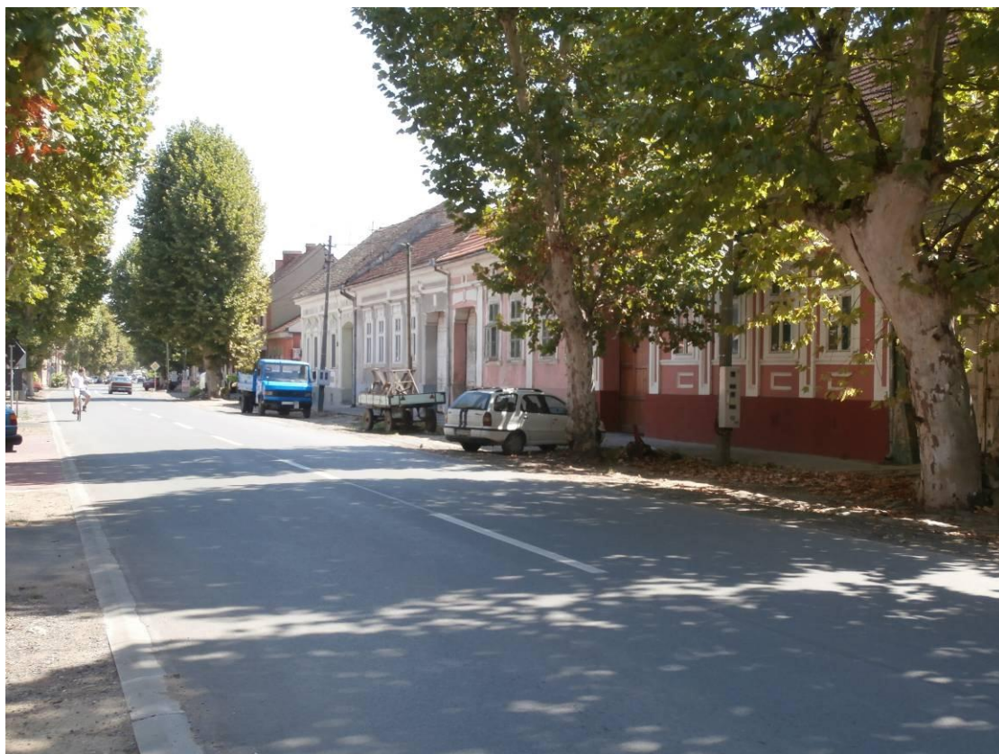
Улица Пролетерска - изглед