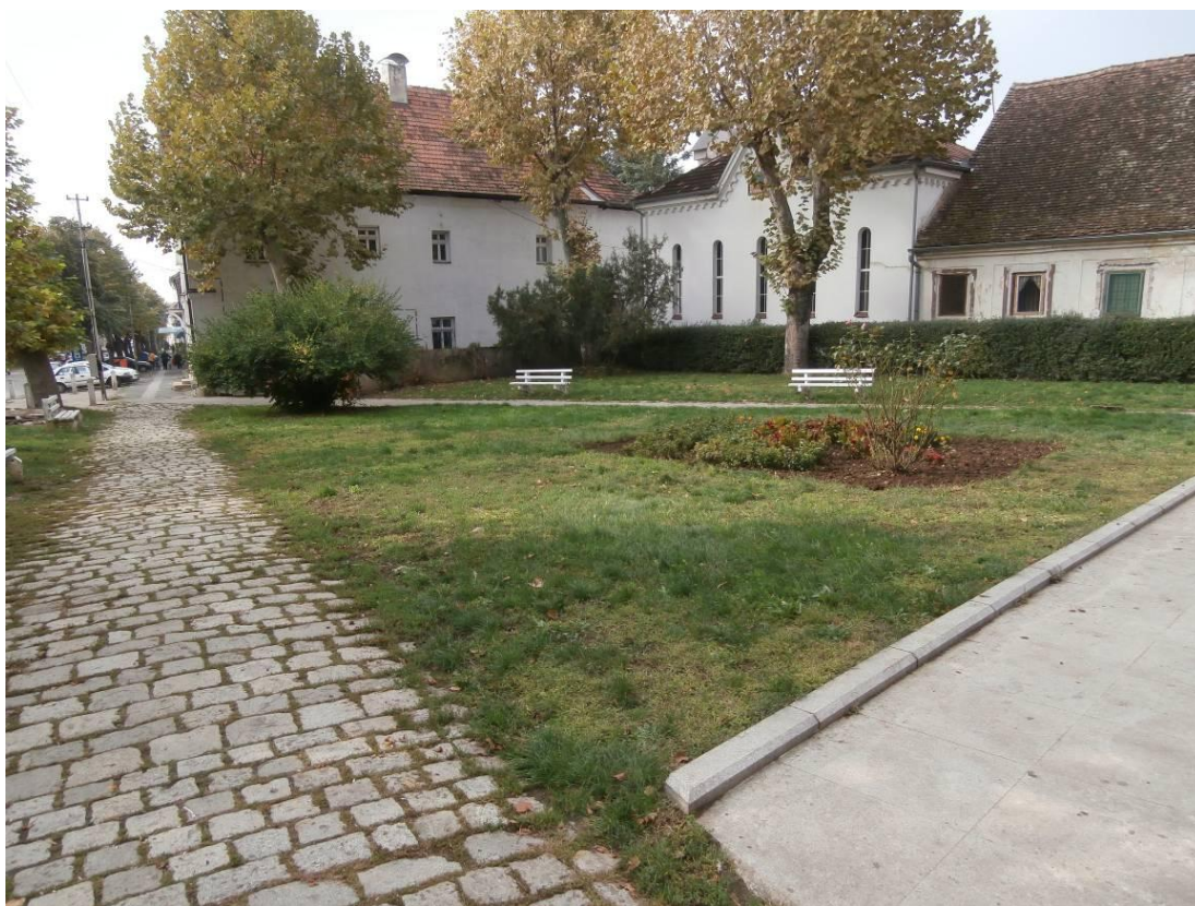
ТРГ РУСКИХ КАДЕТА – изглед